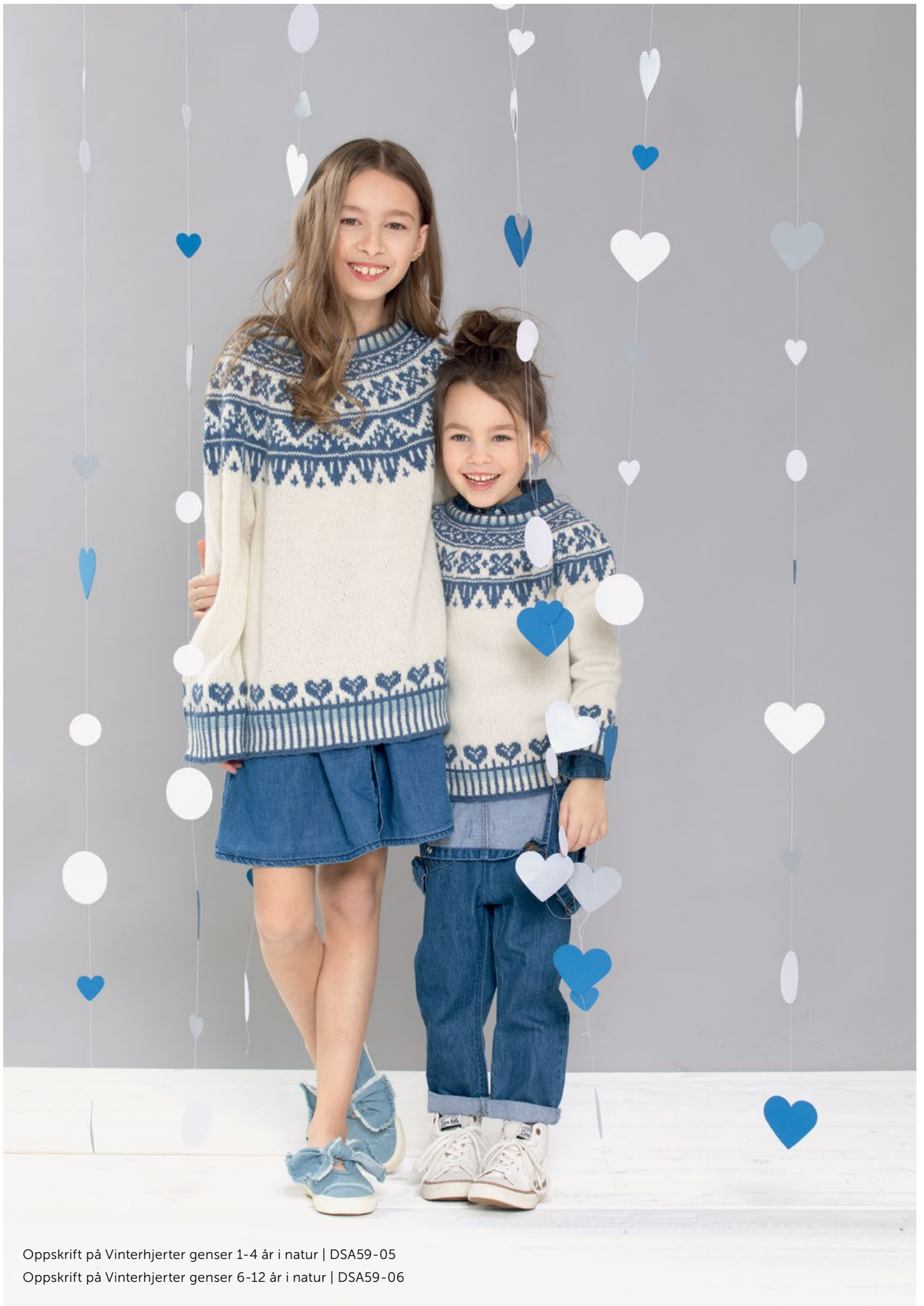
Oppskrift på Vinterhjerter genser 1-4 år i natur | DSA59-05 Oppskrift på Vinterhjerter genser 6-12 år i natur | DSA59-06